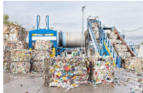
Il primo passo del processo di riciclo presso Alier consiste nella dissoluzione del materiale dei sacchi di carta usati.

Quando la materia prima arriva all'impianto di riciclo, viene inserita in un pulper, dove la carta viene separata dal polietilene e dai residui dei sacchi usati. Il polietilene passa attraverso le sezioni di lavaggio ed estrusione e viene trasformato in granuli, venduti sul mercato. La polpa viene poi trasferita alla cartiera, dove viene trasformata in carta riciclata. Prima che la carta riciclata venga venduta ai trasformatori, la qualità della carta viene accuratamente controllata nel laboratorio