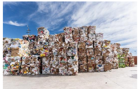
I sacchi di carta vengono preparati per il riciclo e stoccati prima di essere trasportati al centro di riciclo.